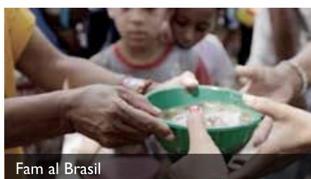
Fam al Brasil

Per altra banda, la fam, un problema que havia sigut un dels fo-