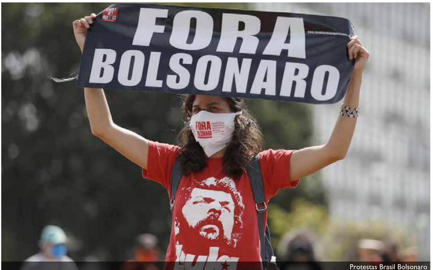
Protestas Brasil Bolsonaro

Amb tot, Lula da Silva té experiència i carisma i sembla que és conscient que el país necessita un gran pacte nacional per treure el país del fons del pou. Als brasilers els falta oxigen i molts han percebut que al costat de Bolsonaro l'aire està enrarit.