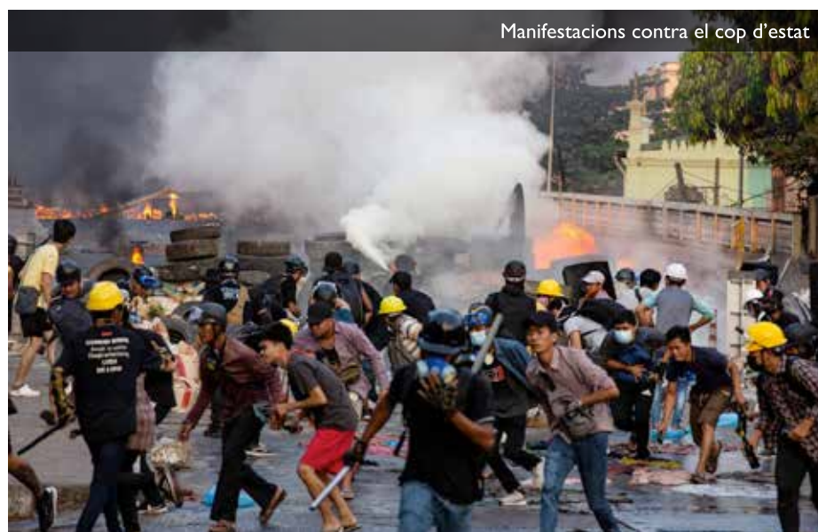
Manifestacions contra el cop d'estat

rección, más allá de la demanda de libertad y del retorno del gobierno de Aung San Suu Kye. La evolución de la crisis birmana es imprevisible, pero solo una sostenida movilización popular con huelgas que paralicen el país hará retroceder a los militares. Si las protestas y las huelgas continúan bajo el paraguas de la LND, que carece de un plan concreto para derrotar a la Junta militar, el futuro seguirá siendo sombrío porque sus objetivos apenas pasan por recuperar el gobierno aceptando una democracia vigilada, débil, demediada, que asegure una economía capitalista, y la debilidad de la izquierda, consecuencia de décadas de represión y muerte, no permite esperar a corto plazo un cambio social. El 28 de febrero, los militares asesinaron a dieciocho personas en las calles birmanas; tres días después otras cuarenta personas murieron a balazos, y la Junta, que no tiene intención de ceder, respondió con el toque de queda a la huelga general de diez días convocada a partir del 8 de marzo. Los tanques patrullan Rangún.