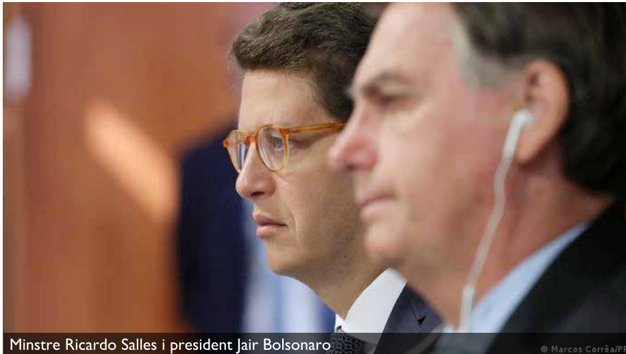
Minstre Ricardo Salles i president Jair Bolsonaro