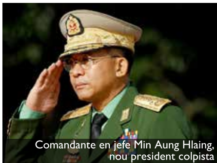
Comandante en jefe Min Aung Hlaing, nou president colpista

China, Estados Unidos, India y Japón. India, tercera potencia en escena, tiene un complicado expediente: teme que aumente la actividad de los grupos armados birmanos en su frontera y le inquieta que un mayor acercamiento suyo al Tatmadaw empuje al movimiento democrático hacia China: Delhi y Tokio temen que la resolución de la crisis aumente la influencia china. Además, Pekín y Delhi están interesadas en los yacimientos de gas birmanos. Por su parte, Estados Unidos y la India quieren atraerse a Birmania para limitar la influencia china en toda la región.