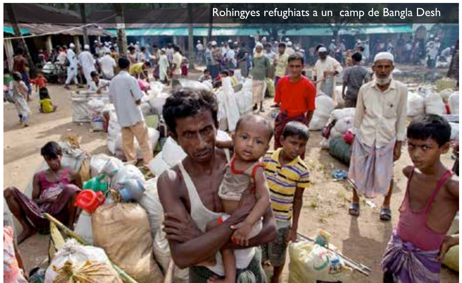
Rohingyes refughiats a un camp de Bangla Desh

limitar su poder, porque esa carta magna reserva la cuarta parte de los escaños del parlamento al ejército, y para aprobar cambios constitucionales se precisa una mayoría parlamentaria de más del setenta y cinco por ciento, de manera que cualquier modificación que no tenga el acuerdo de los generales es imposible.